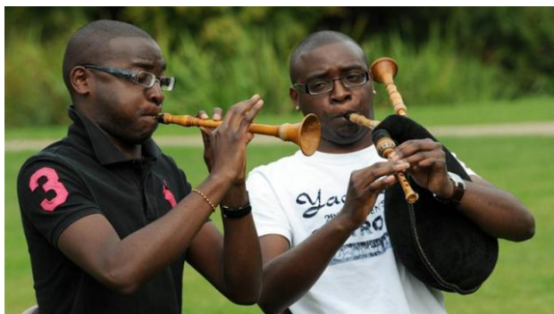
Bombarde et biniou koz