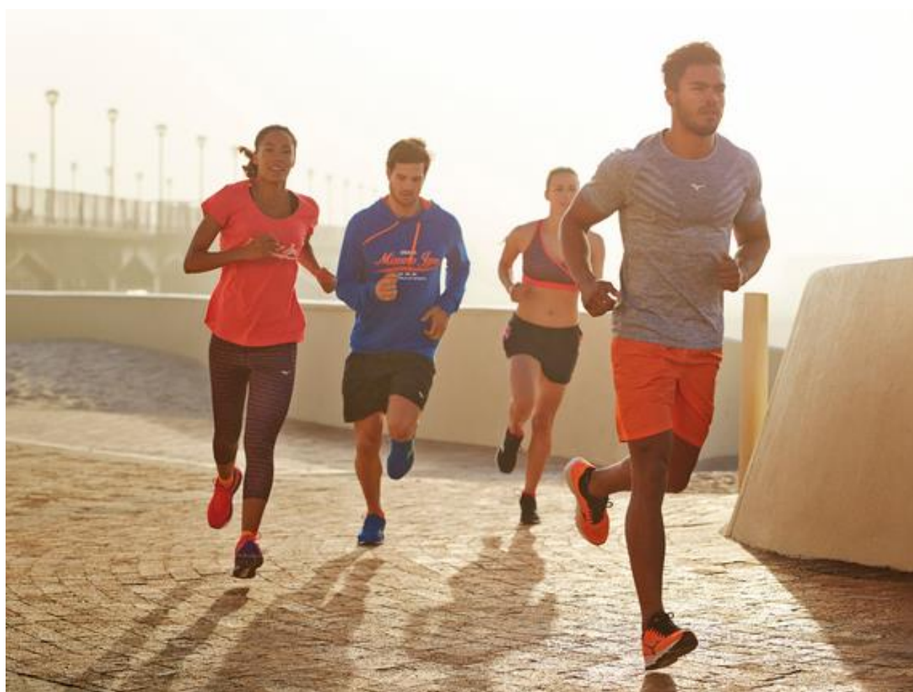
Illustration de l'épreuve